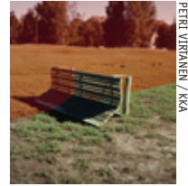
PETRI VIRANEN / KKA