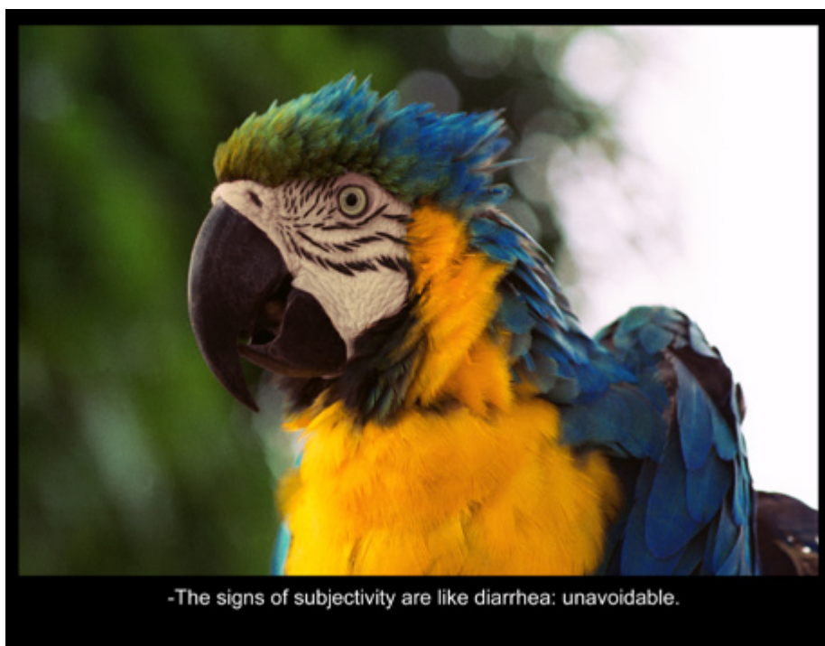
-The signs of subjectivity are like diarrhea: unavoidable.

Sergio Vega: Genesis papukaijosten mukaan , 2002–2005 (video)