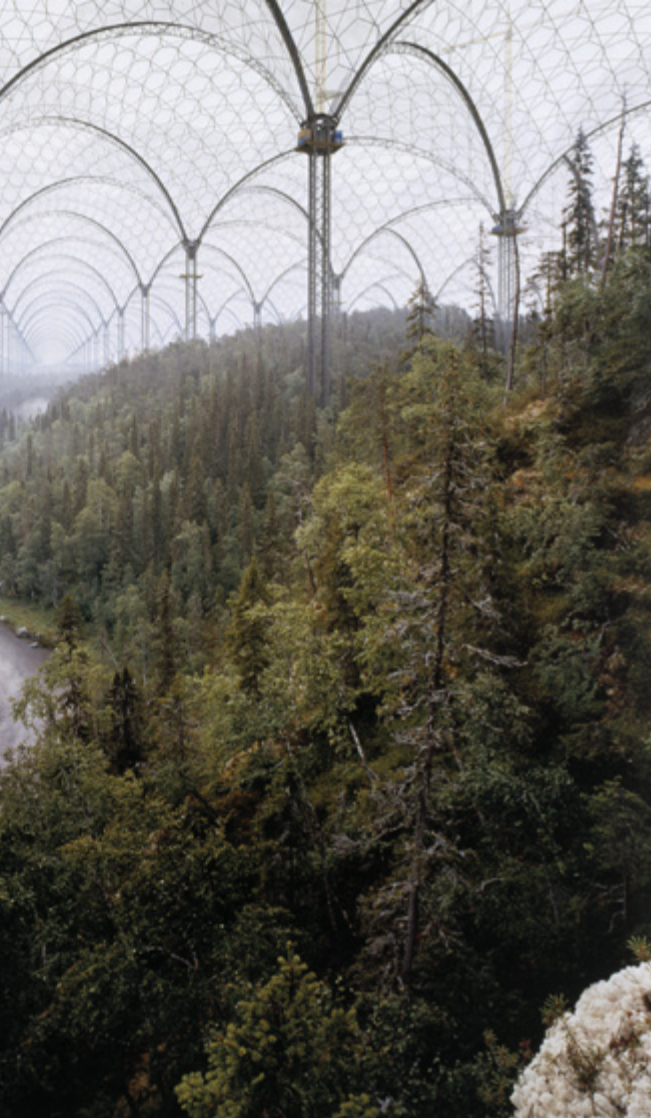
Ilkka Halso: Kitkajoki, 2004 (yksityiskohta)