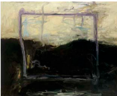
PETRI VIRRANEN / KKA