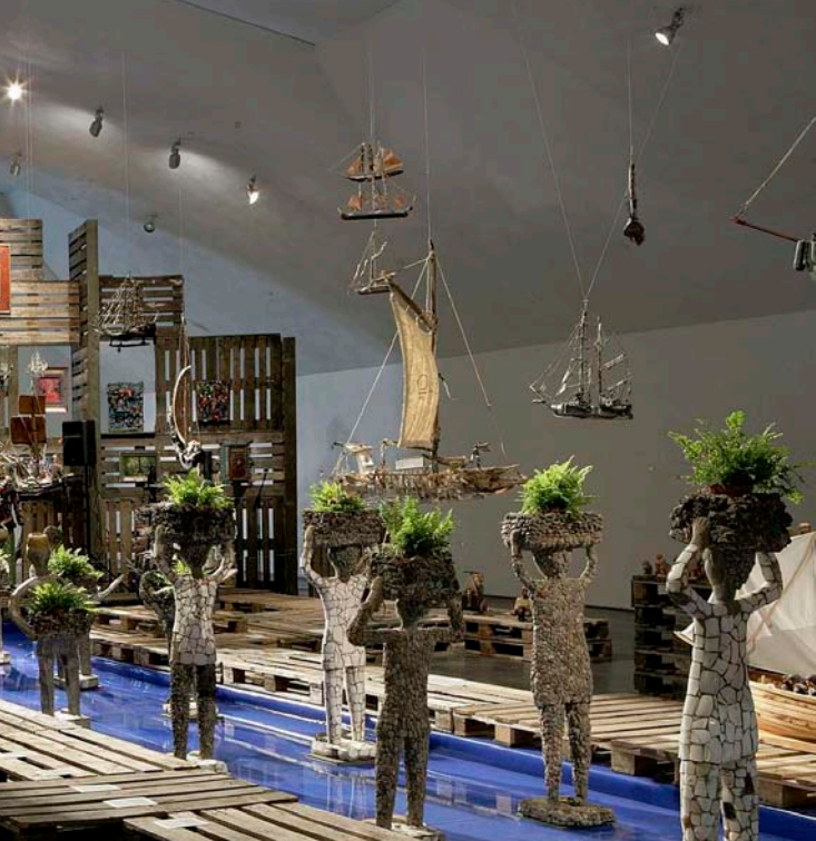
KPM / KEMPPINEN TINKER

Näkymä Omissa maailmoissa -näyttelystä Viidennessä kerroksessa.