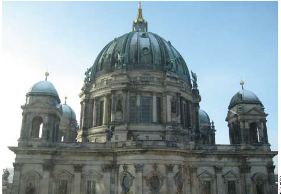
Berliinin Tuomiokirkko ja Alexanderplatzin tv-torni sijaitsevat entisen Itä-Berliinin alueella

Muurin murruttua vuonna 1989 alkoivat entisen Itä- ja Länsi-Berliinin alueet muovautua uudestaan. Itä kiinnosti taiteilijoita halpojen vuokrien, tyhjien tehdaskiinteistöjen ja muiden taiteen tekemiseen ja esittämiseen sopivien tilojen vuoksi. Taiteilijoiden asetuttua itä alkoi vetää puoleensa trenditietoisien putiikkeja, kahviloita ja klubeja. "Kaikki uusi ja kiinnostava tulee itäpuolelle, erityisesti Mitteen. Entisen Länsi-Berliinin alueet ovat henkisesti köyhtyneet" kertoo Bischoff.