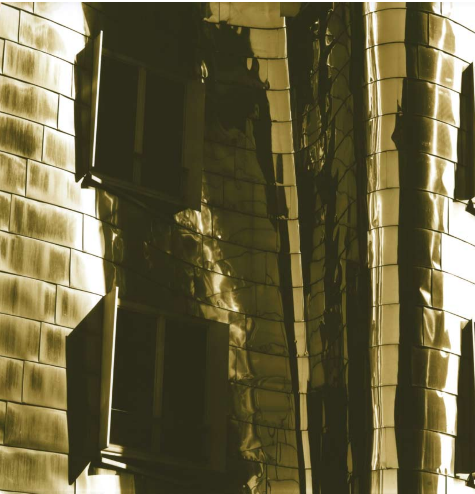
Ola Kolehmainen: Index of Fantasy, Uncanny, and Desire, 2007