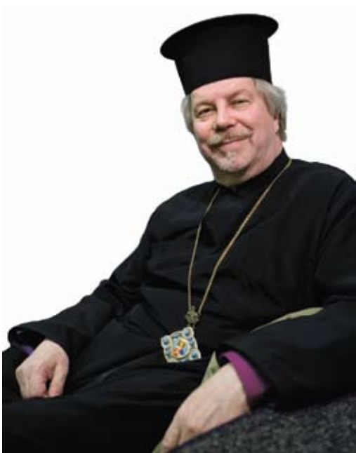
Helsingin metropoliitta Ambrosius

Henkilökuvien lisäksi sarjassa on kuvia luonnosta, arkkitehtuurista, pyhiinvaelluskohteista ja uskontoihin liittyvistä esineistä. Installaatioiden mate-