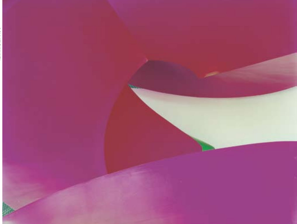
Ola Kolehmainen: Voluptuous, 2008

Kuvataiteilijoiden muuttoaallon jälkeen tulivat galleristit, kuraattorit ja yksityiset keräilijät.