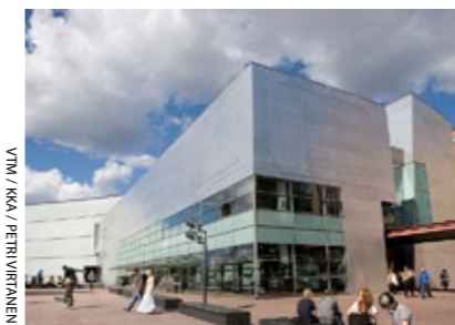
YML / KSA / PEINURINEN

NYKYTAITEEN MUSEO on perustettu 1991, Kiasma rakennettu 1998. Rakennuksen suunnitteli arkkitehtikilpailun voittaja Steven Holl, USA. Kiasmassa on viisi kerrosta. Kokonaisala on 12 000 m 2 , josta museotiloja on 9 100 m 2 . Kiasman taidekokoelmassa on n. 7 900 teosta kotimaista ja kansainvälistä nykytaidetta. Nykytaiteen museo Kiasma kuuluu Valtion taidemuseoon.