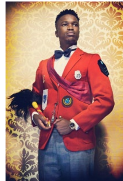
Kudzanai Chiurai: sarjasta Ministerit, 2009