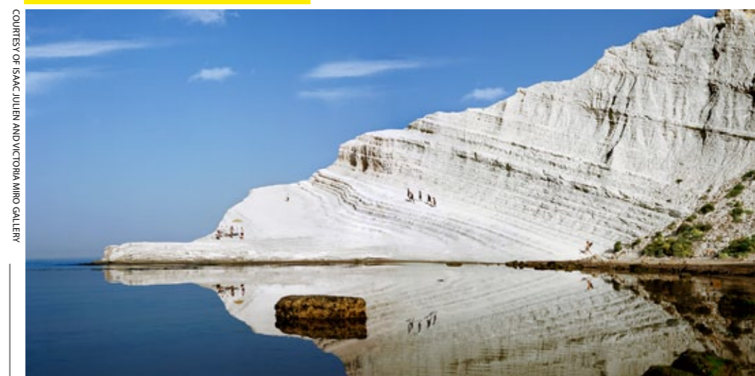
Isaac Julien: Flight Towards Other Destinies 1 (Western Union Series No. 2) 2007, Fujitrans in lightbox 120 x 244 cm

KIASMA Chiasm , ~a, s (anat) risteys, risti ~us s (pl~i) (ret) kiasmi. Kiasma , hermojen, vars. näköhermojen eli näköjuosteiden, risteys. Kiasma (kreik. khiasma = viivaristeys, X-kirjaimen muodosta), tuman kypsymisjakautumisessa diploteenivaiheessa todettava kohta, jossa vastinkromosomit kietoutuvat toisiinsa. > Crossing over .