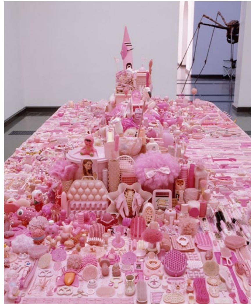
VTM / RKA / ANTTI KURJALAINEN, HANNU AALTONEN