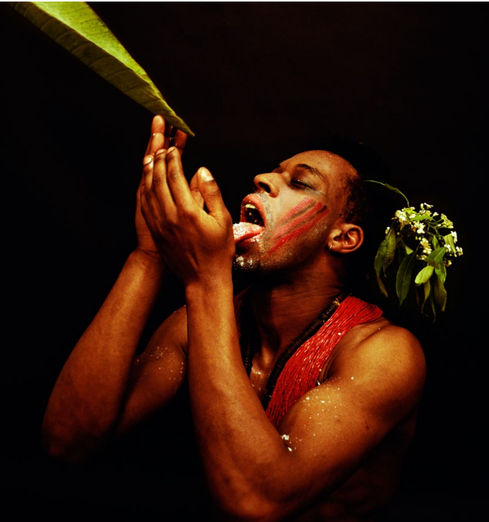
Rotimi Fani-Kayode: Ei mitään menetettävää VII, 1989