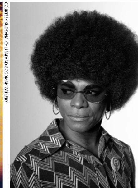
Samuel Fosso: sarjasta Afrikkalaishenget, 2008