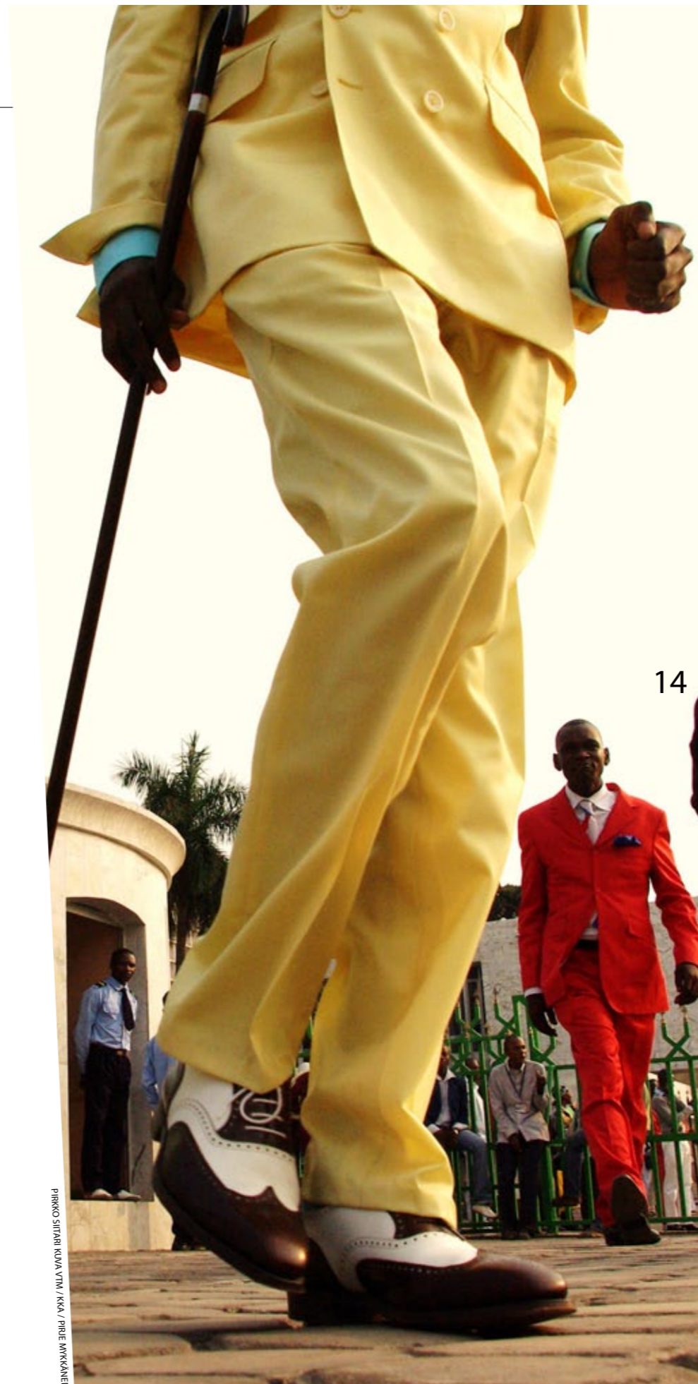
PIRKKO SIITARI